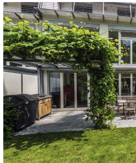
Eine Pergola spendet Schatten und trägt stimmig zum Gesamtbild bei.

Sehr beliebt sind auch Alleebäume, deren Krone einen breiten flachen Charakter hat. Es sind dies in «Dachform» geschnittene und flachgezogene Züchtungen. So gezeigte Gehölze vermitteln Leichtigkeit und sind ein willkommener Sonnenschutz bei einem Gartensitzplatz und auch bestens geeignet für begrenzte Platzverhältnisse. Ist ein Baum in der Nähe des Wohngebäudes geplant, sollte ein Gehölz mit lichter Krone und feinem Laub gepflanzt werden. So werden durch den Schattenwurf die eigenen Wohnräume nicht zu Dunkelkammern.